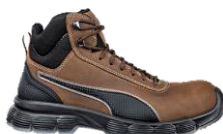
CONDOR BROWN MID 630122