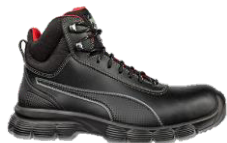
CONDOR BLACK MID 630101