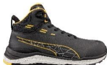
XPLORE ANTHRACITE/YELLOW MID 635630