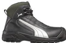
CASCADES MID 630210